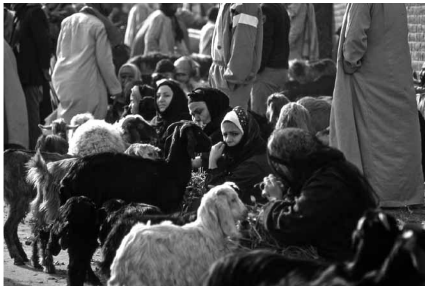
エジプト・フスタートの動物市

います。古代からずっと、もちろん肉類は、人々に最も好まれた食材であり続けたのですが、肉はたいそう高価な品でありました。そして、最も滋養に富む食品と考えられています。しかし20世紀初頭でも、地域差はありますが、中東では肉類を毎日食べる事ができた人たちは、少数であったという報告もあります。現在では、都市の家庭では普通に肉は食べられています。経済的に貧しい人にとっては、依然として高価な食品といえましょう。