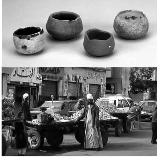
(上) 小碗 9～14世紀 エジプト・フスタート出土 早稲田大学蔵 (下) スエズの行商

ビア語に翻訳させて、引き継いだのです。古代ギリシヤ語からアラビア語に訳された哲学・数学・天文学などの学術書は、12世紀以降に今度はアラビア語からラテン語に訳され、中世ヨーロッパ世界に紹介されたことも付け加えておきます。