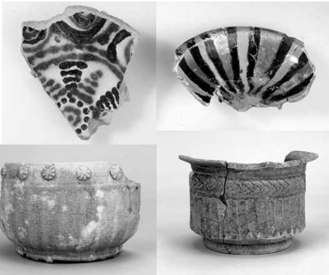
イスラーム陶器 10～14世紀 エジプト・フスタート出土 早稲田大学蔵

今からおおよそ7000年ほど前に中東で麦栽培が始まり、それと並行して、羊と山羊の牧畜が開始されました。中東地域での牧畜は、食肉生産業ではありません